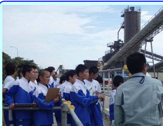
➤ ご見学された入野中学校1年生の皆様