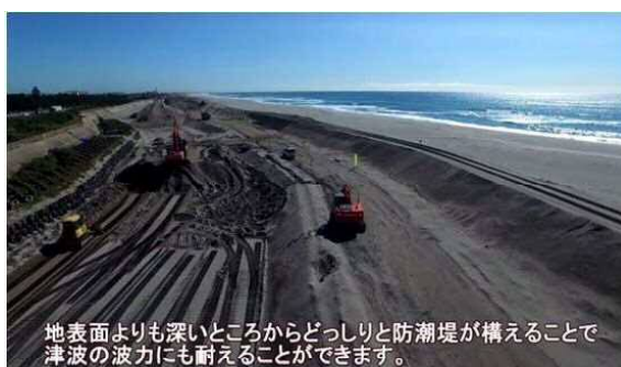
地表面よりも深いところからどっしりと防潮堤が構えることで津波の波力にも耐えることができます。