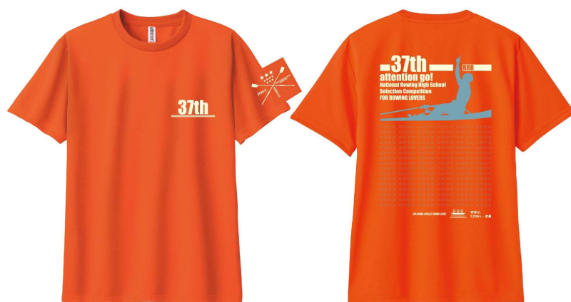
Tシャツ本体038.サンセットオレンジ プリントカラー アイボリー×アシッドブルー