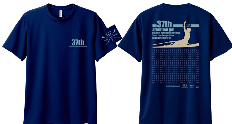
Tシャツ本体 167.メトロブルー プリントカラー アシッドブルー×ライトベージュ