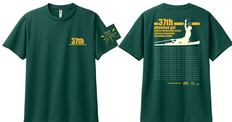
Tシャツ本体 138.アイビーグリーン プリントカラー デイジー×アイボリー