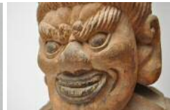
左) 折り紙のお地藏さま 右) 《木造十王坐像》<閻魔大王> (部分)

ooooいなさ文化財まつりoooooooooooooooooooooooooooo