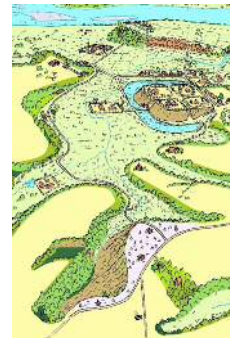
引馬城(古城)を崖ヶ崖付近から遠望した鳥瞰図(想像図)

今回の発掘調査は、元城町東照宮・同町自治会のご協力を得て、境内のうち神域としての景観に影響を与えない一部を試掘するものです。指定した範囲を人力で掘削し、遺構・遺物の検出を試みます。終了した調査区は埋め戻して現状に復します。調査期間は、平成26年8月4日(月)から22日(金)までを予定し、平日午前10時から午後3時までは、調査のようすを公開します。なお、現地説明会を8月17日(日)の午前10時と午後1時30分から予定しています。調査の成果については、広報はまつコラムに掲載するほか、今年度内に速報します。