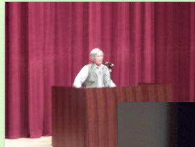
事例紹介をされる皆さまの様子

早朝から集積所で資源物回収の指導や集積所の管理を13年間行われていて、地域のみなさんと会話を交わすことを楽しみに活動されているとおっしゃっていました。