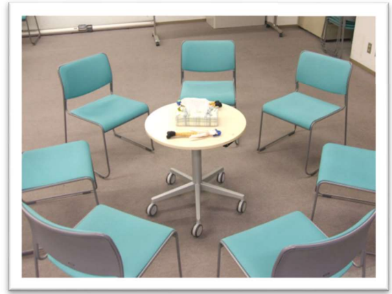
椅子を丸く並べて語り合いを行っています。