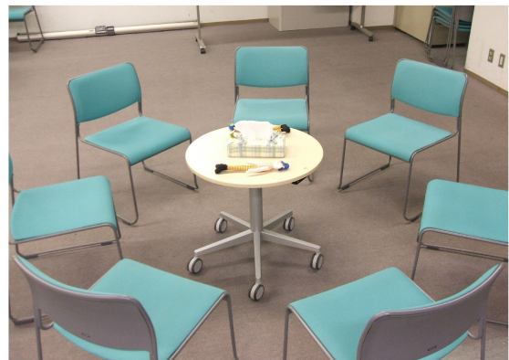
写真のように椅子を丸く並べて語り合いを行っています。