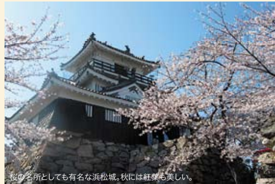
桜の名所としても有名な浜松城。秋には紅葉も美しい。

女をアゲるヒントは浜松城にも隠されていた!? 若き日の徳川家康の野望が薫る浜松城