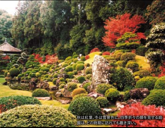
秋は紅葉、冬は雪景色に。四季折々の顔を見せる庭園は、どの時期に訪れても趣き深い。