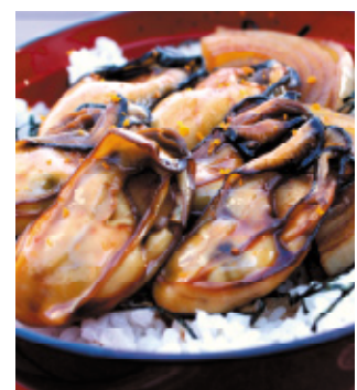
小鉢・味噌汁・香の物・デザート付 / 1,500円