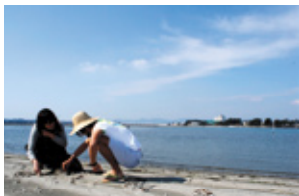
干潮時だけ現れる干潟は、最高のプライベート空間。

海水と淡水がほどよく混ざり合う浜名湖は天然あさりの宝庫。シーズン中は、家族連れが多く集まる潮干狩りスポットとして有名な場所。弁天島海浜公園から瀬渡し船で約3分。干潮の前後2時間が潮干狩りに最も適した時間帯だ。そんな浜松屈指のレジャースポットである弁天島の新定番は「プライベートビーチ」。例えば、彼女への告白。誰もいない湖の真ん中、そこはまるで無人島。うつとりするようなシチュエーションの中、大声で「好きだーっ!!」と叫ぶサブライ