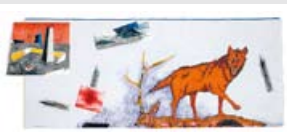
Test Zone III 12

日本国内だけでなく、海外でも高い評価を得ている浜松市出身のアーティスト・柳澤紀子氏。今回は、浜松市美術館と隣にある平野美術館の2会場で同時開催し、現代の人間・身体の在り様を問いかける個性的で深淵な作品群を紹介。版による表現にとどまらず、様々な技法を駆使した作品世界を鑑賞できる機会です。