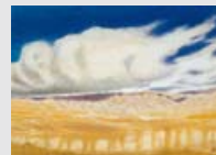
秋野不矩 <アフガニスタン風景> 1972年

秋野不矩は旅をきっかけに作品構想を練ったり、逆に、暖めた構想を確固なものとするために旅に出ました。インドを描いた作品のほか、日本国内やアフガニスタン、カンボジア、アフリカなどを訪れて描いた「暮れる海」<アフガニスタン風景>、<廻廊アンコールワット>、<ティレム人の居住跡>などを中心に展示します。