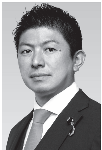
参政党代表・神谷宗幣