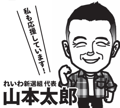
れいわ新選組 代表 山本太郎