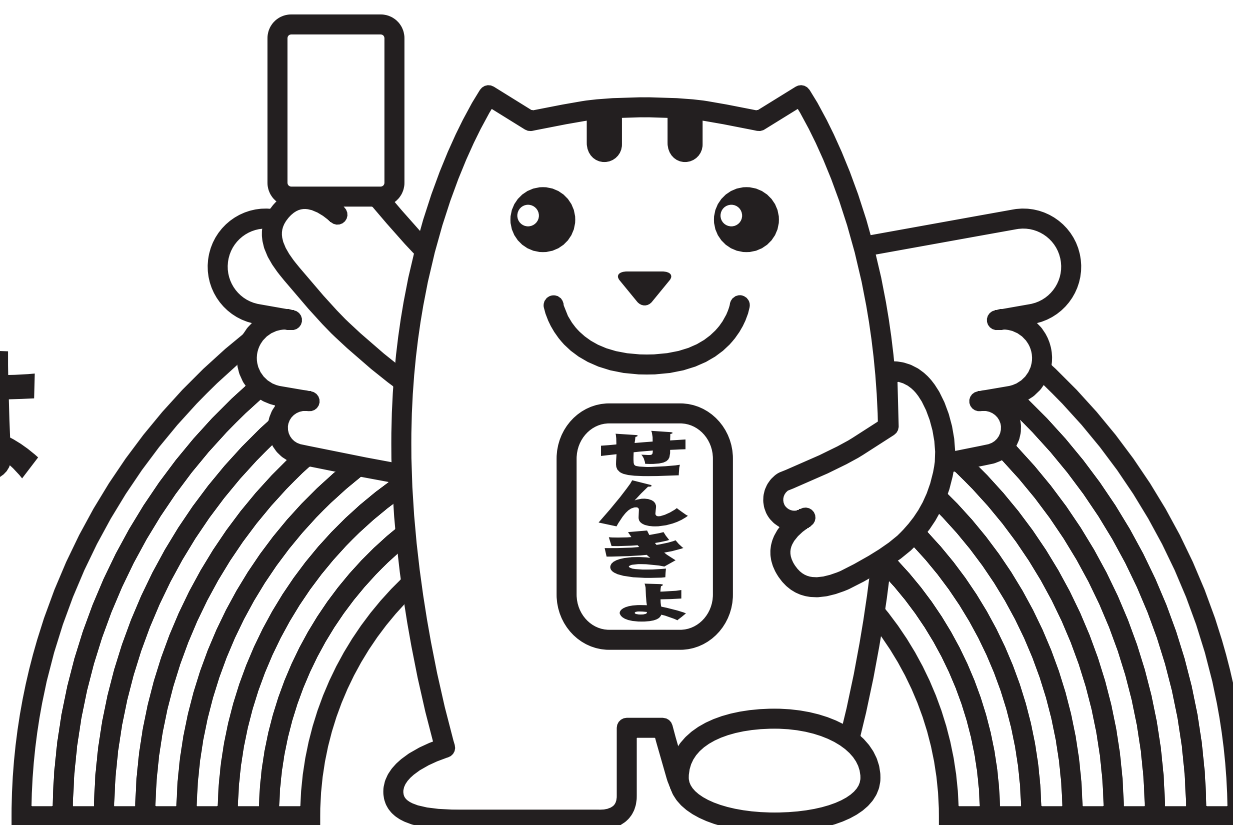
選挙のめいずいくん