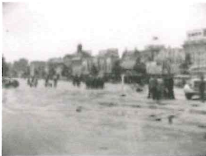
浜松駅前 (昭和初期)