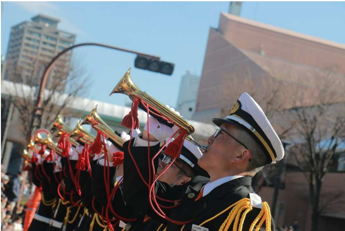
浜松市消防団ラッパ隊