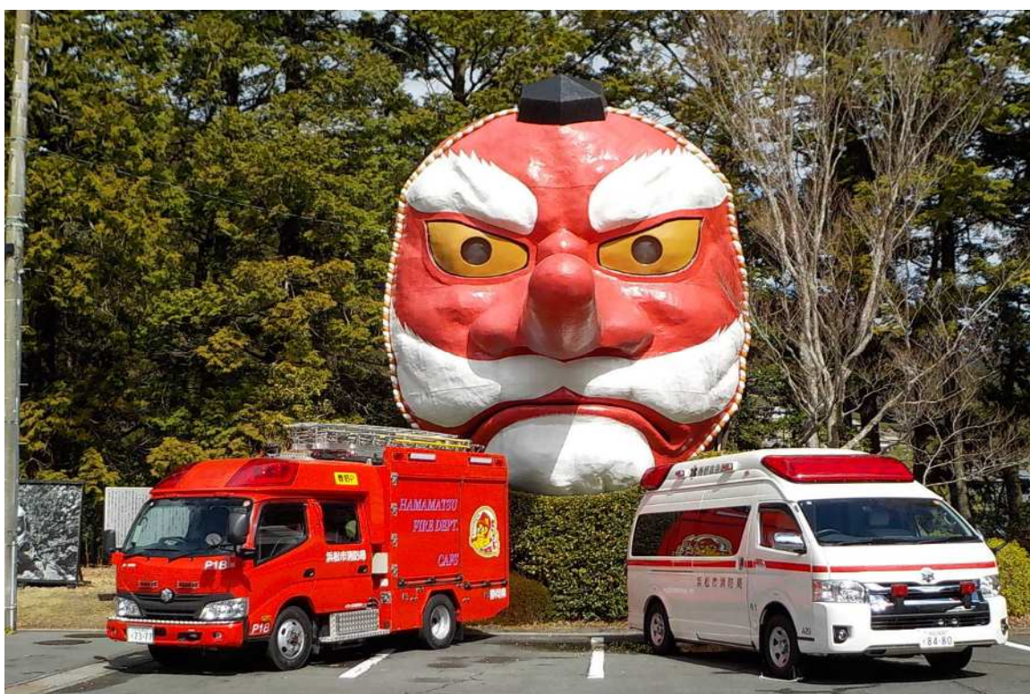
日本一の大天狗面