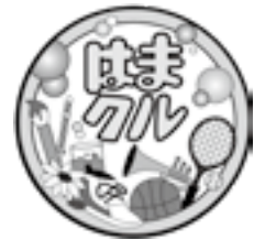
「はまクル」 ロゴマーク