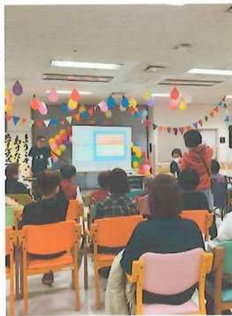
【健康長寿の講演会】