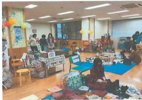
【フリーマーケット会場】