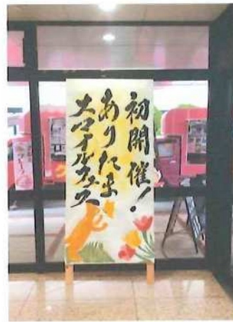
【高校書道部による題字】