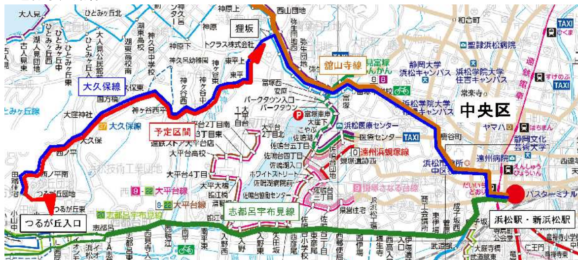
【遠州鉄道株式会社公式ホームページ「遠鉄バス電車路線図」を加工】