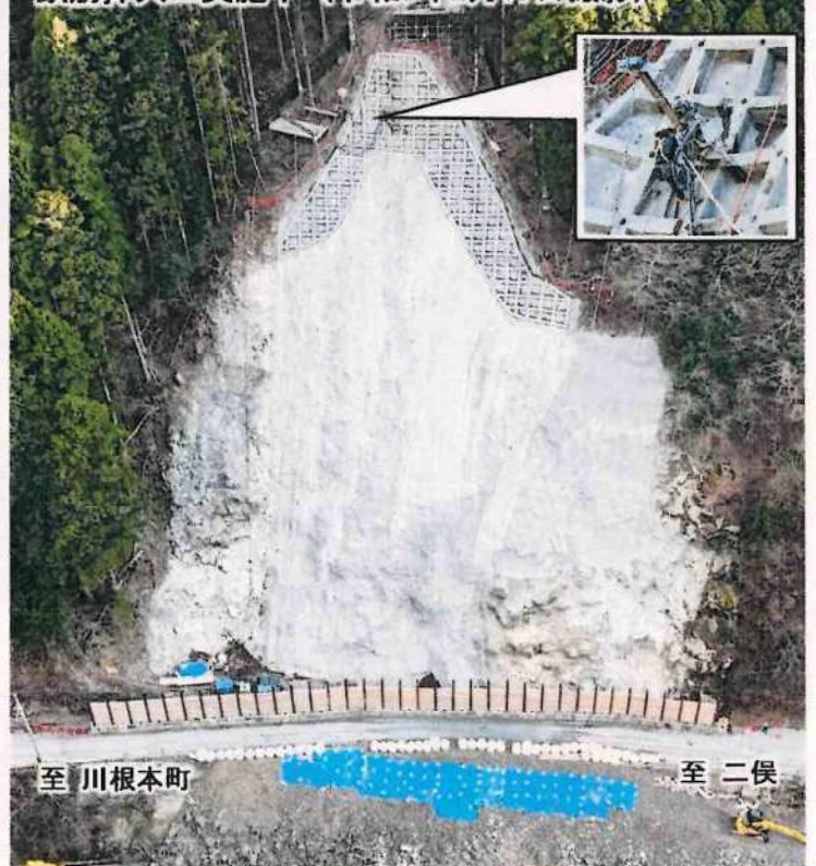
鉄筋挿入工実施中 (令和8年2月17日撮影)

県道春野下泉停車場線及び水窪森線等の迂回路をご利用ください ※連続雨量超過の場合は迂回路も事前通行止めとなります