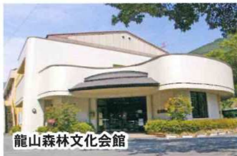
龍山森林文化会館