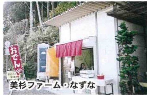
美杉ファーム・なずな