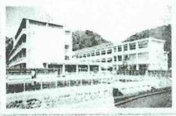
▲二俣小学校 左:明治40年、右:昭和44年