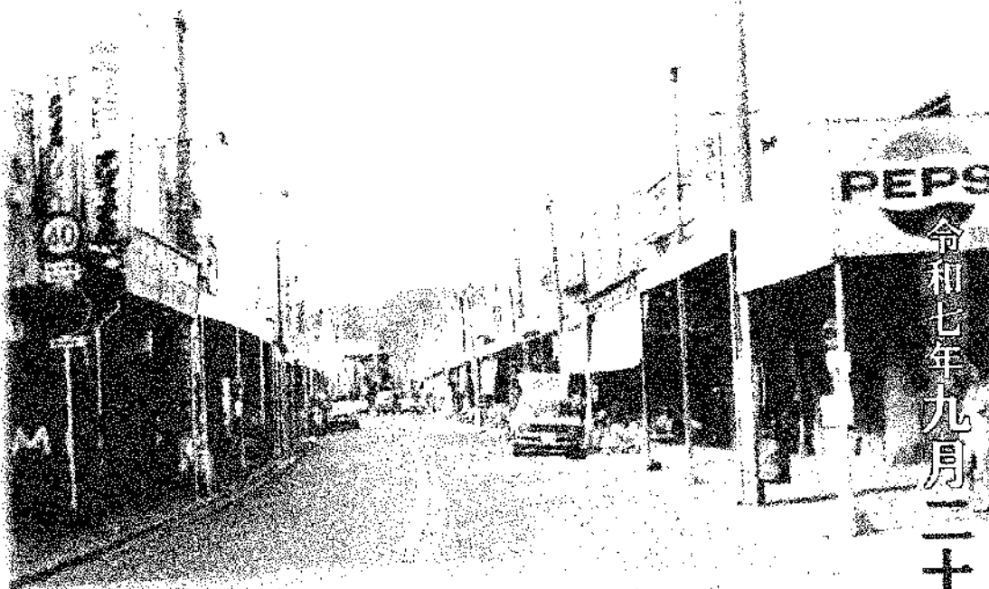
天竜川沿道・新街（昭和40年代）