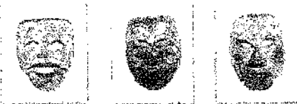
翁 三番叟 松影