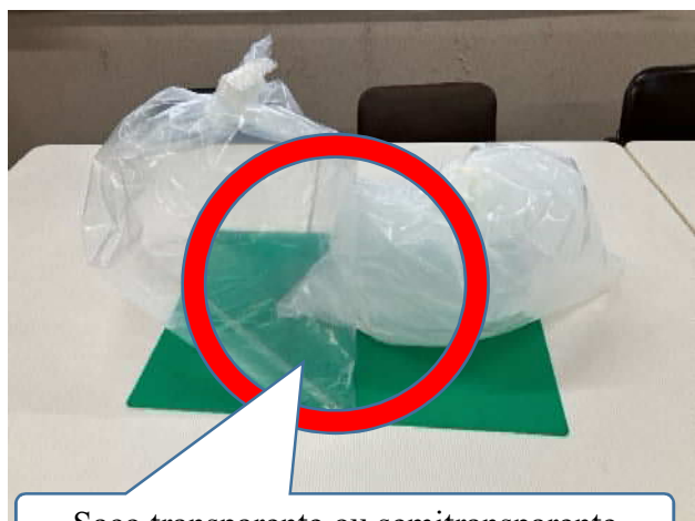
Saco transparente ou semitransparente