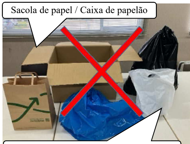
Sacola de papel / Caixa de papelão