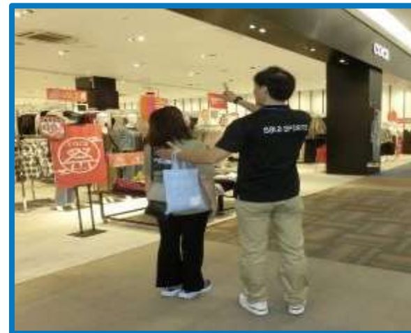
ウォーキングフォームの指導