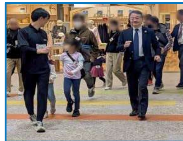
市長もウォーキングに参加