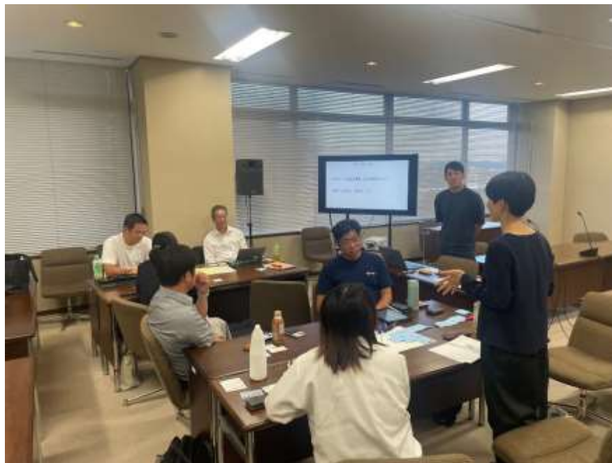
<各班で自由に意見出し>