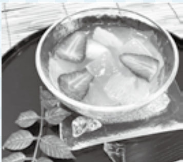
今月のパワーフード ハチミツ