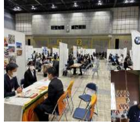
【合同企業説明会の様子】