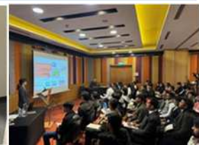
【セミナーのイメージ】