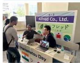
【マッチングイベントの様子】