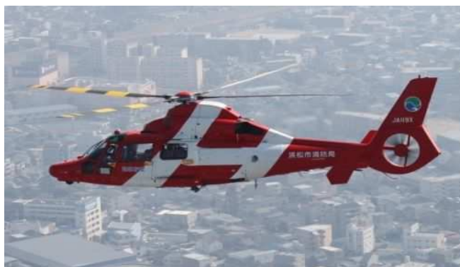
消防ヘリコプター「はまかぜ」 エアバス・ヘリコプターズ社 AS365N3 型（フランス）