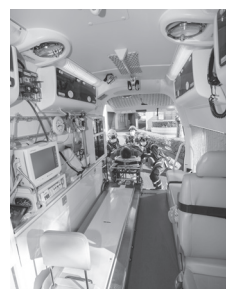
Boletim informativo de HAMAMATSU Dezembro /2025

Este boletim é a tradução parcial do informativo em japonês "Koho Hamamatsu". Todos os telefones para informações são para atendimento em japonês.