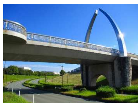
北都橋と都田テクノロード