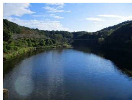
増沢調整池越しの吊橋