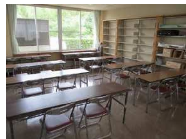
コミュニティルーム