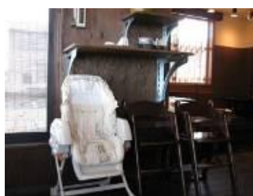
とら (らーめん土蔵／大柳町)

お店に子ども用のいすや食器が用意されていると、子ども連れでの利用がしやすくなります。