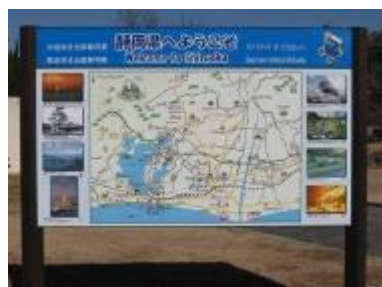
(県営遠州灘海浜公園／中田島町)

6か国語(日本語、英語、中国語、ハングル、ポルトガル語、スペイン語)の表示があると、外国人にとっても親切です。