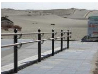
(中田島砂丘入口／中田島町)