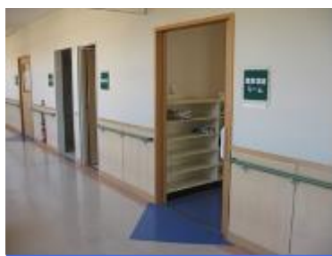
(東部保健福祉センター／青屋町、龍光町)

入口に段差がないので、小さなお子さんや子どもを抱えた人にも安全な造りになっています。