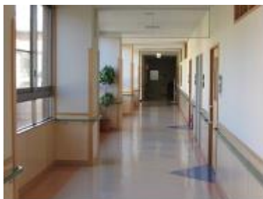
(東部保健福祉センター／青屋町、龍光町)

十分な広さがあり、床には各部屋の出入口が分かるように印があるので、安全に歩くことができます。