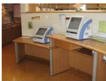
(可新図書館／小沢渡町)

子どもや車いす利用者も利用しやすいように、高さを変えて書籍検索機が設置されています。