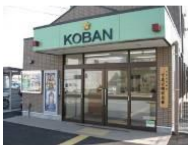
(可美公園前交番／増楽町)

視覚障がい者誘導用ブロックや、大きな取っ手のついた引き戸など、みんなが利用しやすくなっています。