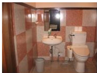
とら (らーめん土蔵／大柳町)

広いトイレがあると、車いす使用者や子ども連れの人でも安心してお店を利用することができます。