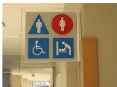
(東部保健福祉センター／青屋町、龍光町)

一目で分かりやすい絵文字のサインがあると、子どもや外国人へも伝わりやすくなります。