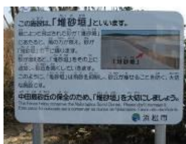
(中田島砂丘入口／中田島町)

外国語(英語、ポルトガル語)で表示することや、漢字にふり仮名をふることで、より多くの人に伝えることができます。