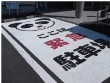
(宗宮こどもクリニック／恩地町)