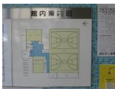
(飯田市民サービスセンター／飯田町)