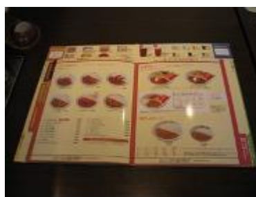
(カレーハウス CoCo 巻番屋三島店／三島町)

メニューには、使われている材料が書いてあるので、アレルギーのある人も安心して食事ができます。