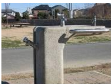
(三島・楊子公園／三島町、楊子町)

手すりや、力を必要としない蛇口など、子どもや体の不自由な人も使いやすくなっています。