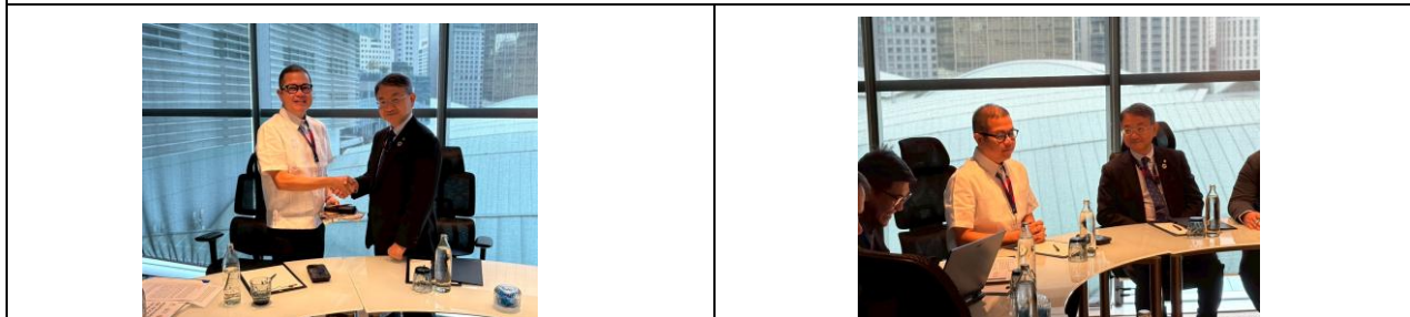
8月13日（水）午前、フィリピン共和国ア克兰州知事との会談