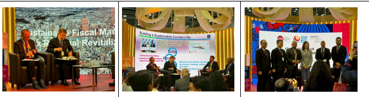
8月13日（水）午前、セッションへの登壇