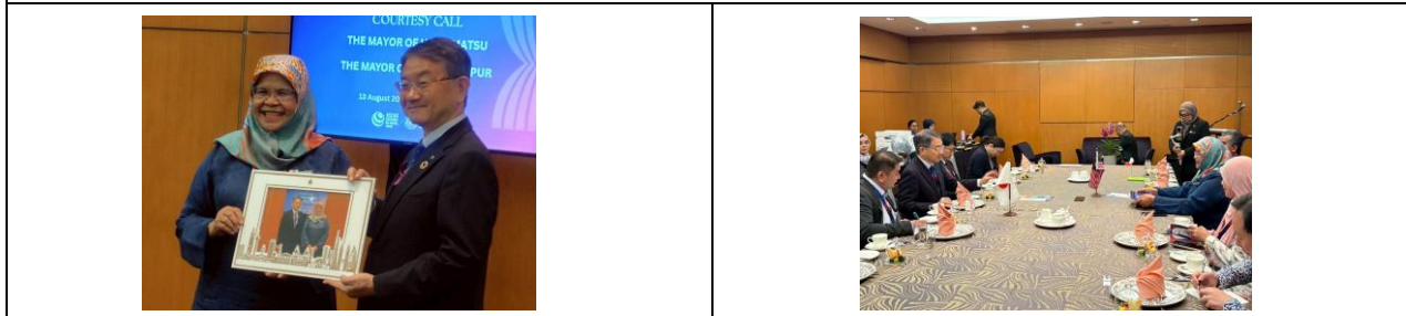
8月13日（水）午前、マレーシア・クアラルンプール市長との会談