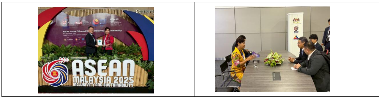
8月12日（火）午後、UCLG ASPAC 事務局長との会談