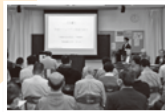
地域課題について意見交換をする地域の皆さん