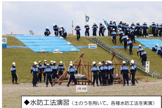
◆水防工法演習（土のうを用いて、各種水防工法を実演）