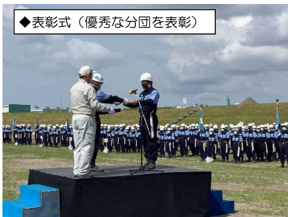
◆表彰式（優秀な分団を表彰）