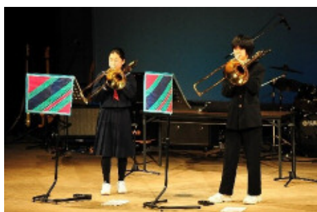
水窪中学校 クリエイティ部 吹奏楽