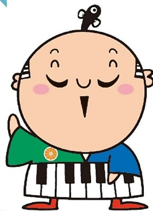
出世大名 家康くん