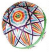
小松の口かがり糸まり