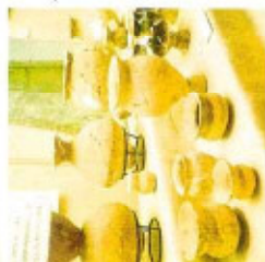
▲弥生土器(芝本・東原遺跡群)

た。遠鉄芝本駅周辺の芝本遺跡や、その南の東原遺跡からは家(竪穴住居)の跡やお墓(方形周溝墓)が発見されています。