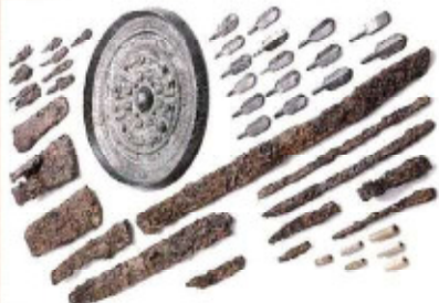
▶三角縁神獸鏡・鉄刀など(赤門上古墳)

浜北区内では内野の赤門上古墳(古墳時代前期、県指定史跡)、宮口の眞覚寺後古墳(後期、市指定史跡)をはじめ多くの古墳がつくられました。