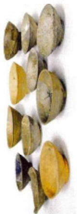
◀灰箱陶器(宮口古窯跡群)

浜北区内では集落の遺跡や、窯跡などが発見されています。平安時代には、浜北区宮口周辺で「灰箱陶器」の生産がさかんに行われました。