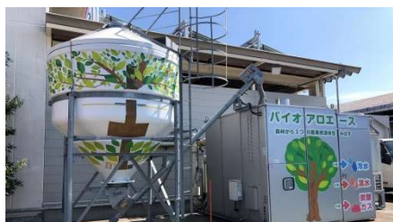
①木を燃料とした空調システム