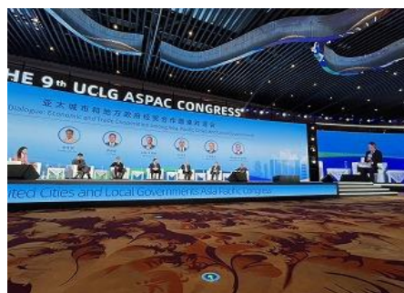
メインフォーラムの様子