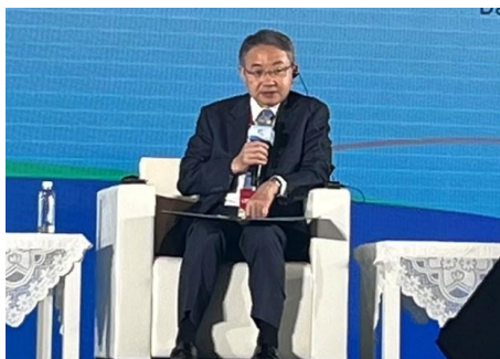
メインフォーラム登壇時の市長

また、同日、午後には執行理事として執行理事会に出席するとともに、ベルナディア UCLG ASPAC 事務局長との会談を行いました。