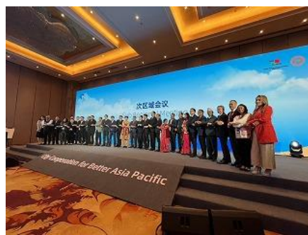
執行理事会の集合写真