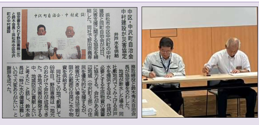
報道資料（左） 調印式の様子（右）