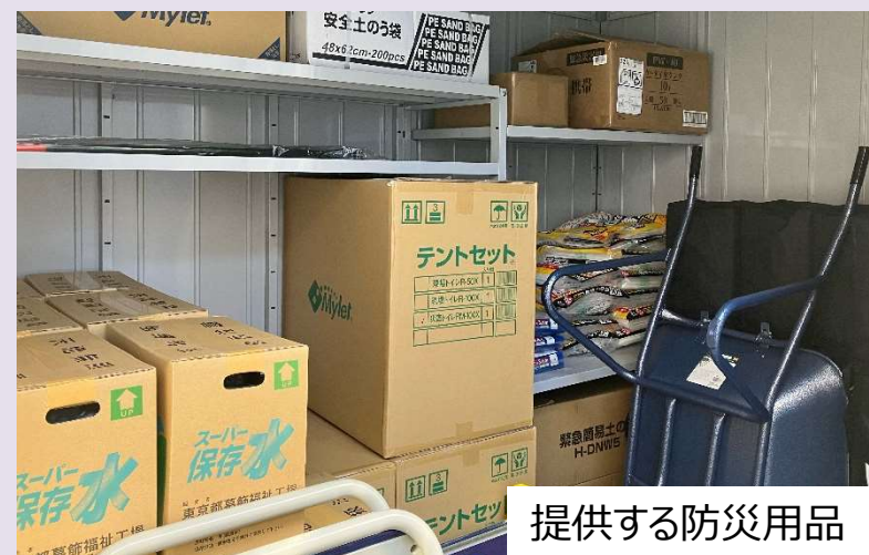
提供する防災用品