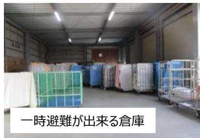
一時避難が出来る倉庫