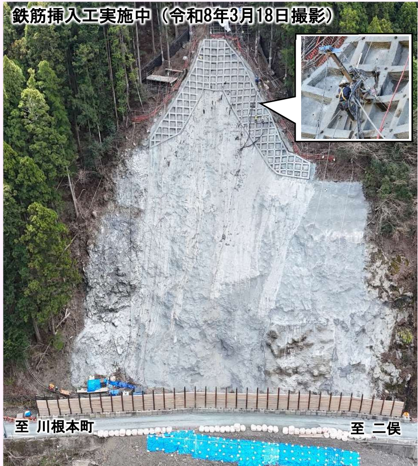
鉄筋挿入工実施中 (令和8年3月18日撮影)