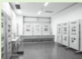
▲昨年の「科学の学園祭」

また、浜松科学館では、「みらい～ら自由に研究ラボ」に参加した子供たちの研究成果の中から、「探求賞」を決定し、表彰します。その他の研究成果についても、秋に開催予定の「科学の学園祭」で展示します。