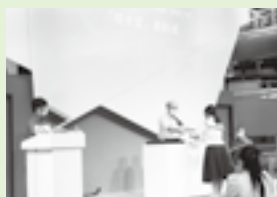
▲昨年の「探求賞」表彰式

昨年の「みらい～ら自由に研究ラボ」の研究成果は、浜松科学館公式 note に掲載されています。 みんなの研究成果を覗いてみよう！