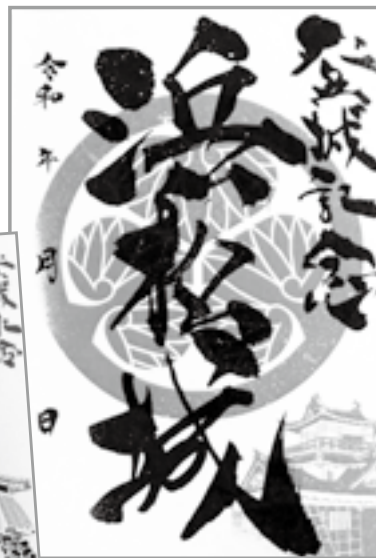
2023年限定 切り絵御城印