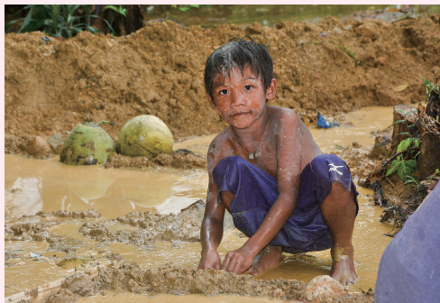
2017年5月31日 フィリピン・マニラ 家族の生計を支えるため、子どもたちは泥や水銀の中で砂金採りをします

カカオやコットン農家のほか、コーヒーなどのプランテーション、すてられた家電製品の解体作業、もの売りなどがあります。