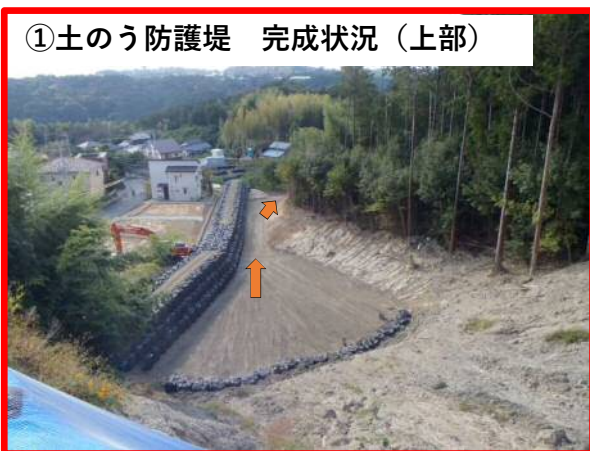
①土のう防護堤 完成状況 (上部)