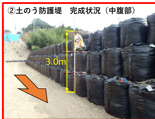
②土のう防護堤 完成状況 (中腹部)