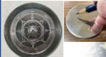
内行花文鏡（三種の神器の一つ）