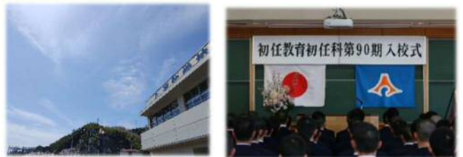
県消防学校（静岡市清水区）

県消防学校以外に、消防大学校や救急救命研修所への研修派遣も実施しています。救急救命研修所では、半年間の研修を受け、救急救命士の国家資格の取得も可能です。これまでに、3人の女性職員が救急救命士の資格を取得しています。