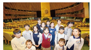
ニューヨーク国連本部での会議に参加したキッズアンバサダー!!