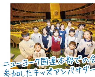
ニューヨーク国連本部での会議に参加したキッズアンバサダー!!